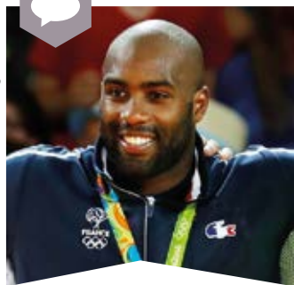
Teddy Riner champion olympique, du monde et d'Europe et parrain de la fête du Sport de Ramonville, des 24 et 25 juin 2017