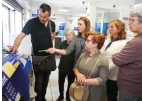
▲ L'atelier "automates" du forum numérique des Seniors

À l'issue de ces deux années d'activités, le conseil des Seniors s'apprête à se lancer en septembre prochain dans un très beau projet qui vise à mettre en relation les habitants d'un même quartier en privilégiant la proximité, les affinités et la réciprocité des échanges. À suivre donc... /