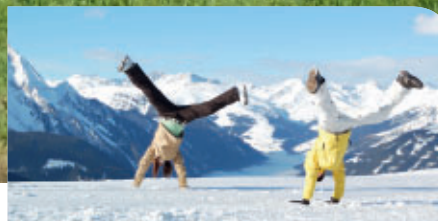
P. 5 ACTIVITÉS JEUNESSE POUR LES VACANCES D'HIVER