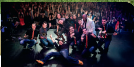
P. 4 L'ÉCOLE DE MUSIQUE AU RYTHME DE LA MUSIQUE LATINE