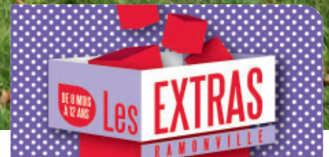
P. 11 et 16 FESTIVAL DES EXTRAS

AU sommaire: actualités P. 4 Urbanisme : permanences du service P. 7 Participez à la dénomination des voies de l'éco-quartier Maragon-Floralies tous citoyens P. 8 Familles à énergie positive sortir-bouger P. 12 Espace musique de la médiathèque entre Méditerranée et Occitanie