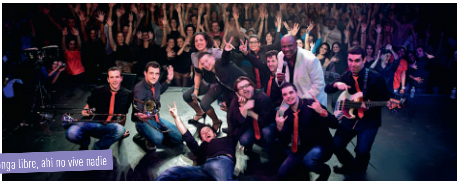
Conga libre, ahí no vive nadie

L'équipe pédagogique de l'école de Musique souhaite sensibiliser les élèves au langage des musiques populaires de la culture latine (salsa, tcha-tcha-tcha, boléro, etc.).