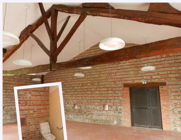
Les travaux de la salle des Fêtes de la ferme de Cinquante arrivent à leurs termes