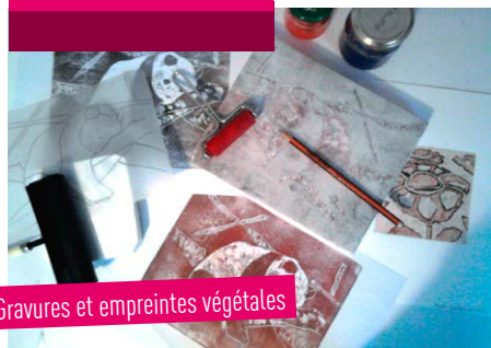
Gravures et empreintes végétales