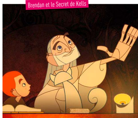
Brendan et le Secret de Kells

C'est en Irlande au 9 e siècle, dans l'abbaye fortifiée de Kells, que vit Brendan, un jeune moine de douze ans. Avec les autres frères, Brendan aide à la construction d'une enceinte pour protéger l'abbaye des assauts réguliers des Vikings. Sa rencontre avec Frère Aidan, célèbre maître enlumineur et « gardien » d'un Livre d'enluminures fabuleux mais inachevé, va l'entraîner dans de fantastiques aventures.