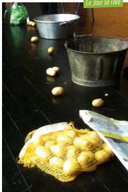
Le Jour se lève

"Je t'ai dit avant de commencer qu'il y a un moment où il faut attendre dans le silence jusqu'à ce qu'on entende une musique. Pas des cris, Drate, une musique."