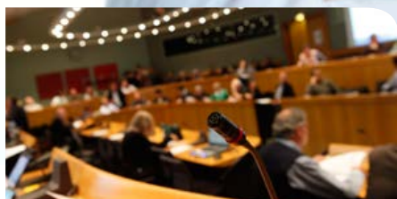
P. 7 NOUVELLE GOUVERNANCE AU SEIN DU SICOVAL