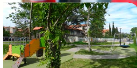
P. 12 EN ROUTE POUR UNE VILLE PLUS PROPRE