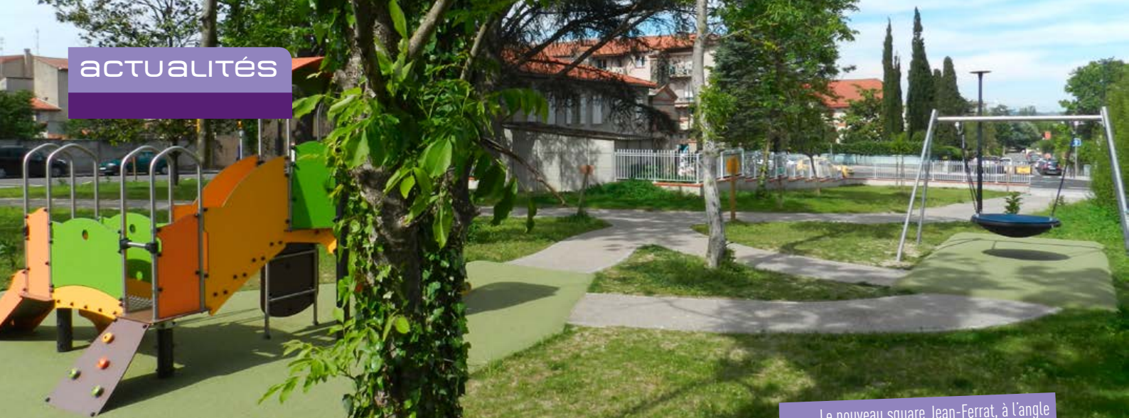
Le nouveau square Jean-Ferrat, à l'angle de la rue de l'Église et de l'avenue Tolosane.