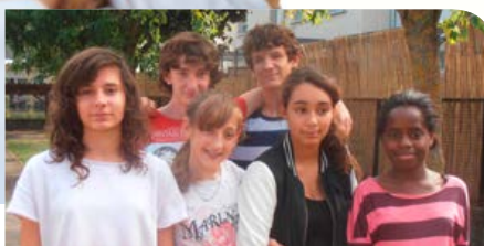
P. 9 RENOUVELLEMENT DU CONSEIL DES JEUNES