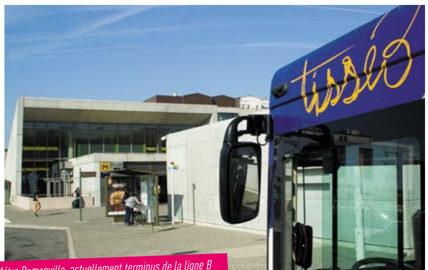
Métro Ramonville, actuellement terminus de la ligne B

Le PLB permet d'améliorer les déplacements et de proposer une alternative à l'usage de la voiture individuelle.