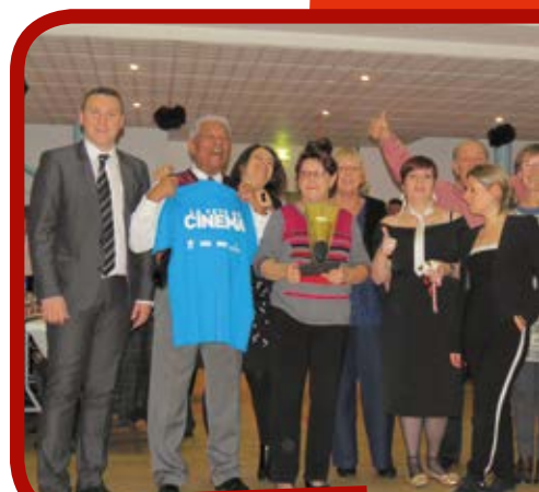
L'équipe gagnante du quizz cinéma

Vacances d'hiver à la ferme [Ferme de Cinquante] Ferme de Cinquante