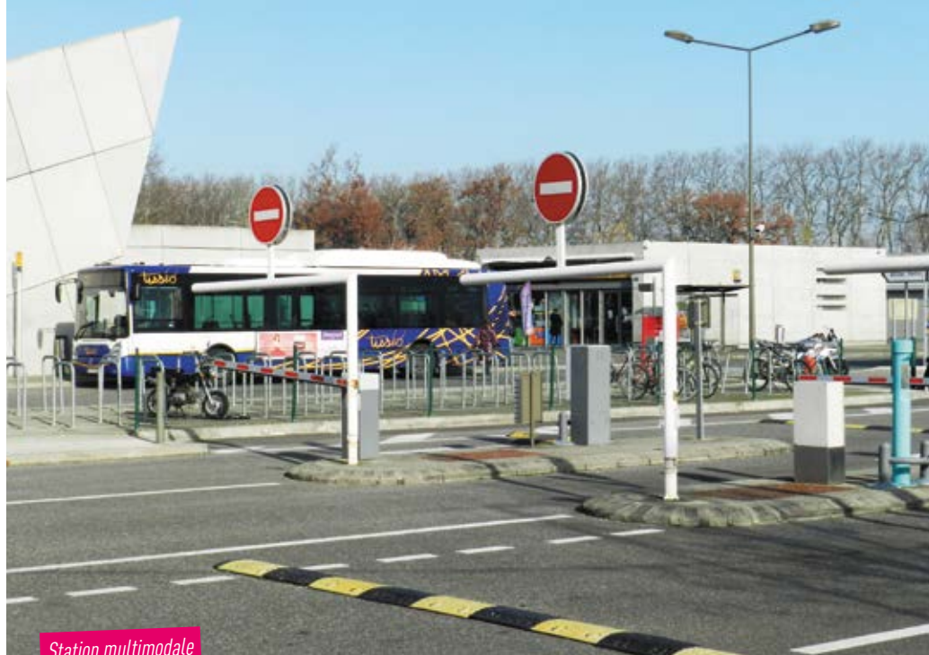
Station multimodale de Ramonville