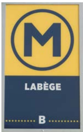
Tracé du PLB