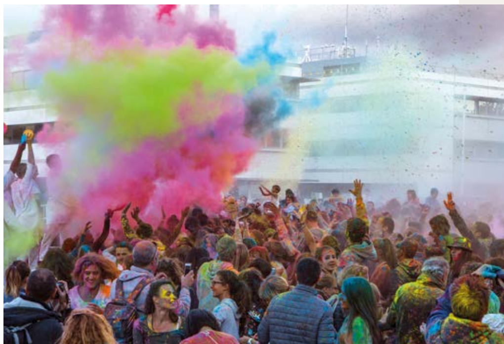
▲ Festival de Rue sur l'esplanade du parc technologique du Canal