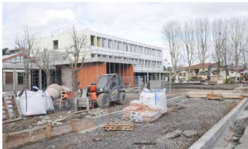
▲ Chantier de rénovation du groupe scolaire Sajus

À cela s'ajoute la mise en œuvre program- mée des « Parcours professionnels, car- rières et rémunérations » (PPCR) au sein de la fonction publique qui viendront peser sur le pilotage de la masse salariale des collectivités dans les trois ans à venir.