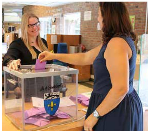
▲ Vote du budget participatif en 2016 à Grande-Synthe (59)

15 % au maximum pouvant être utilisés pour des projets d'animations à l'échelle d'un quartier ou de la commune.