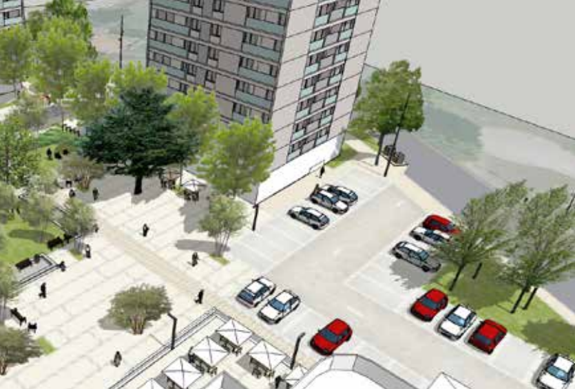
Projection de l'aménagement de la place Marnac © Dessain de ville