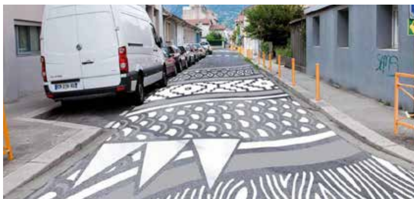
▲ Projet « Un coup de pinceau sur la chaussée » rue du Drac à Grenoble

Le mode de décision, le montant et la nature des projets financés peuvent varier largement d'un projet à l'autre. La grande majorité concerne l'aménagement de l'espace urbain, la nature en ville, les modes de circulation douce ou les équipements culturels et sportifs. /