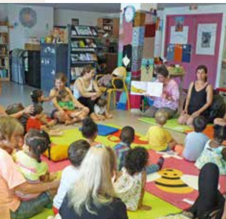
▼ ▲ L'Heure du conte de la médiathèque se déplace au centre social et à l'école d'enseignements artistiques