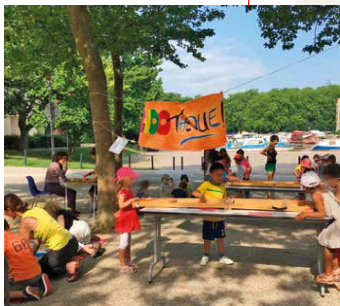
▲ La ludothèque de Regard lors de l'animation Un Air d'été organisée par le centre social d'animation Couleurs et Rencontres en 2018

Elle participe à de nombreuses actions et animations organisées sur la commune (fête du Jeu, Café des parents ou semaine sans écran dans les écoles, Lecture en queue de cerises, etc.) en apportant ses outils (jeux, ateliers artistiques ou d'éveil sensoriel, groupes de paroles, etc.). /