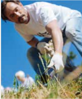
PROJET EN ACTION