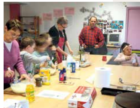
▲ "Cuisine à 4 mains" au centre social Couleurs et rencontres