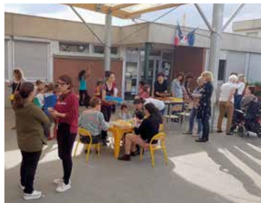
▲ Activités parents-enfants lors de la semaine sans écran à l'école A. Davis.

Conscient que la place des parents à l'école passe également par l'identification des familles en difficulté ainsi que des acteurs et dispositifs du territoire susceptibles de répondre à leurs besoins, le pôle Éducation, Enfance, Jeunesse et Qualité Alimentaire participe activement au réseau local de la parentalité mis en place par le centre social d'animation Couleurs et Rencontres (lire p. 7). /