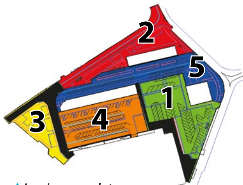
▲ Les cinq zones de travaux

• zone 1 : achèvement des trottoirs et cheminements en béton désactivé courant octobre (nécessitant une journée de fermeture de la zone pour séchage et durcissement du béton). Ces travaux auront lieu après la réalisation, par la copropriété du bâtiment de la galerie commerciale, d'un escalier reliant le rez-de-chaussée à l'étage du bâtiment. Les zones de stationnement en face du numéro 18, conservées comme espace de stockage pour le chantier, seront libérées en suivant. /