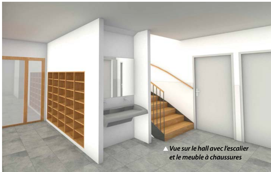
▲ Vue sur le hall avec l'escalier et le meuble à chaussures

Amélioration de la performance énergétique et thermique. /