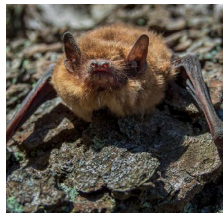
▲ Une chauve-souris pipistrelle prédatrice nocturne du moustique tigre

Contact: moustiquesramonville@laposte.net /