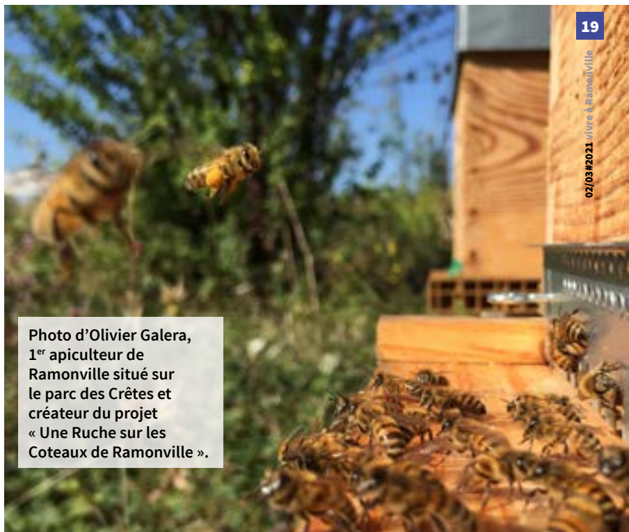
Photo d'Olivier Galera, 1 er apiculteur de Ramonville situé sur le parc des Crêtes et créateur du projet « Une Ruche sur les Coteaux de Ramonville ».

Pôle Environnement et développement durable du territoire