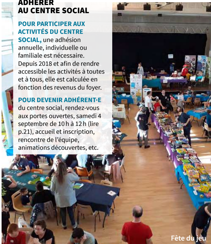
Fête du jeu

du centre social, rendez-vous aux portes ouvertes, samedi 4 septembre de 10 h à 12 h (lire p.21), accueil et inscription, rencontre de l'équipe, animations découvertes, etc.