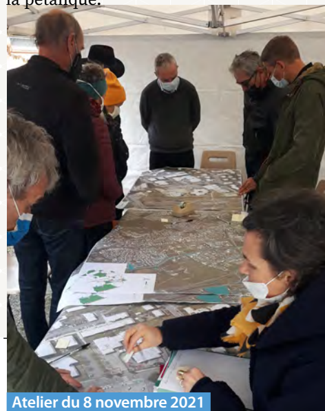
Atelier du 8 novembre 2021

différents usages, une plus grande visibilité des équipements, et beaucoup plus de confort d'usages, par exemple pouvoir marcher d'un bout à l'autre sans se heurter à un bac de végétation, un trottoir dégradé ou une voiture stationnée. Mais ces échanges ont aussi pointé des paradoxes et des contradictions que le projet devra résoudre comme par exemple celui de végétaliser pour créer de l'ombre tout en laissant l'espace libre pour les installations du Festival de rue ou la pratique de la pétanque.