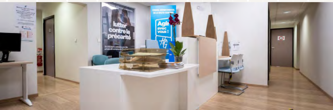
© Conseil départemental de la Haute-Garonne